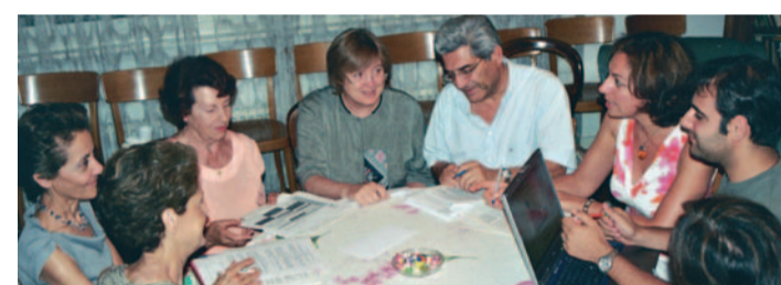
Assemblée locale de Genève (2005), en consultation avec un bahá'í de la communauté

“ Sache, à n'en point douter, que [les fondateurs des grandes religions], en leur essence, ne font qu'une seule et même personne. Leur unité est absolue. Dieu, le Créateur, dit: Il n'y a de distinction d'aucune sorte entre les porteurs de mon message. Ils n'ont tous qu'un seul et même objet, et le secret de l'un est le secret de l'autre. ” (Extraits des Ecrits de Bahá'u'lláh, XXXIV)