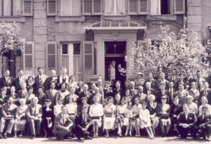
Inauguration du centre national bahá'í à Berne (1955)

> Genève > Centre bahá'í 24, route de Malagnou | 1208 Genève | geneva@bahai.ch >>>>>>>>>>>> > Suisse > Communauté bahá'íe 13, rue Dufour | 3005 Berne | t. 031 352 10 20 > www.bahai.ch 1852 > Premières références dans la presse suisse 1903 > Premiers bahá'ís en Suisse, à Sion/VS 1925 > Premier Bureau international d'information bahá'í à Genève 1955 > Inauguration du Centre national à Berne 1962 > Election de la 1 ère assemblée nationale des bahá'ís de Suisse >>>