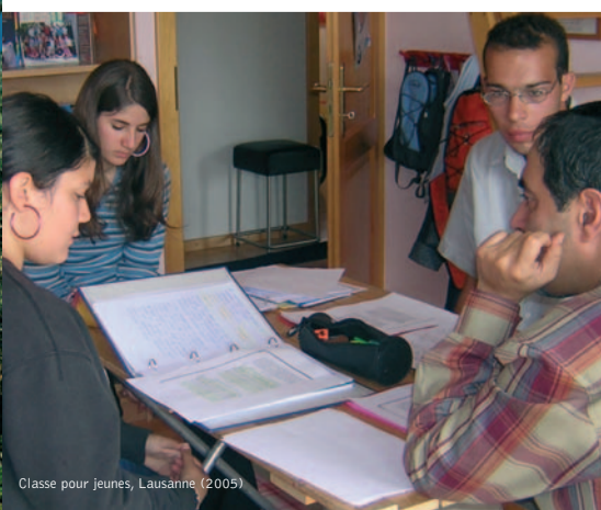
Classe pour Jeunes, Lausanne (2005)