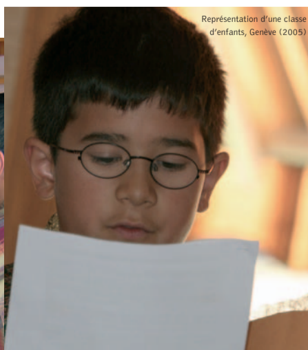
Représentation d'une classe d'enfants, Genève (2005)