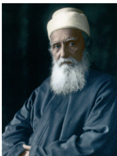
'Abdu'l-Bahá, fils de Bahá'u'lláh. Il séjourna à Thonon durant son voyage en Europe en 1911.

La Foi bahá'íe s'est implantée en Suisse au début du 20 ème siècle. Elle compte aujourd'hui près de 1'100 membres, dont 500 vivent en Suisse romande. Son organisation est largement décentralisée sous la direction d'une assemblée nationale.