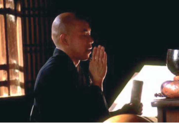
Récitation de sutra

> Genève Centre Zen t. 079 449 48 19 www.zen-geneve.ch (Ecole: Sôtô Zen) > Dojo Zen t. 022 789 32 93 www.zen-deshimaru.ch (Ecole: Zen Deshimaru) > Temple de la Foi Sereine t. 022 731 76 87 www.pitaka.ch (Ecole: Jôdo-Shinshû Suisse) > Vihara de Genève t. 022 321 59 21 www.geneva-vihara.org (Ecole: Theravâda) > Vaud | Neuchâtel | Bienna Centre Djampeille Ling t. 021 634 58 79 www.djampeilleling.org (Ecole: Kagyu) Centre Suisse de Kyabjé Trulshik Rinpoché t. 032 322 18 28 Centre Ewam Rigdzin Sangchen Thegchok t. 079 291 87 22 www.namkha.org (Ecole: Nyingmapa) > Rapten Chœling Mont-Pèlerin t. 021 921 36 00 www.rabten.ch (Ecole: Gueloug) > Sangha de Thich Nhat Hanh t. 021 320 36 58 www.villagedespruniers.org (Ecole: Zen) > Le Zen de l'Ecole AZI pour tous les cantons romands www.zen-azi.org