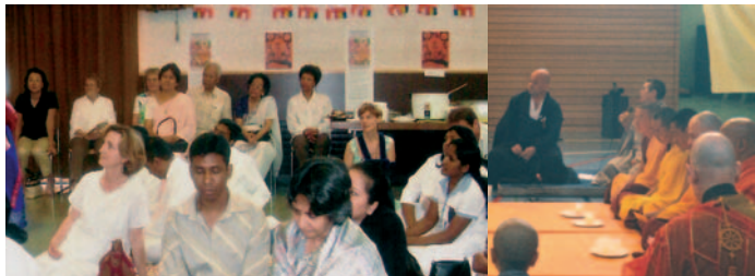
Laïcs durant la fête du Wesak

de l'école Theravâda, célébrée au mois de mai, est l'occasion d'une rencontre de toutes les écoles bouddhistes de Genève et d'ailleurs, pour commémorer à la fois la naissance, l'illumination et la mort du Bouddha.