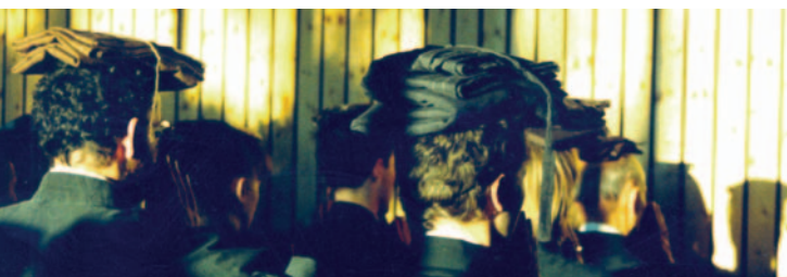
Cérémonie du kesa

Le bouddhisme vietnamien est également présent, à travers le centre social culturel bouddhique vietnamien d'Ecublens, qui s'adresse notamment aux ressortissants du sud-est asiatique.