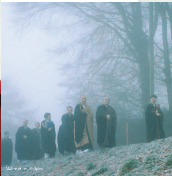
Maître et ses disciples

Pour avoir les coordonnées des Ecoles bouddhiques de Suisse (les groupes de pratique de toutes tendances) > Union des Bouddhistes de Suisse www.sbu.net > Portail sur le bouddhisme www.pitaka.ch > Annuaire www.bouddhisme-universite.org/annuaire.html