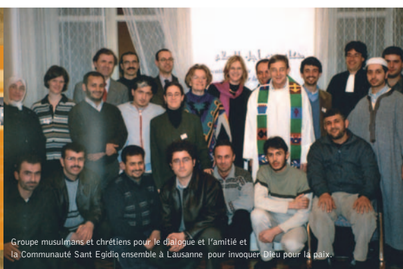
Groupe musulmans et chrétiens pour le dialogue et l'amitié et la Communauté Sant'Egidio ensemble à Lausanne pour invoquer Dieu pour la paix.