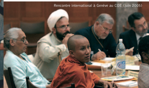
Rencontre internationale à Genève au COE (juin 2005)