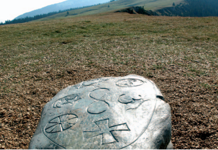
Pierre des religions au Chasseron (VD)