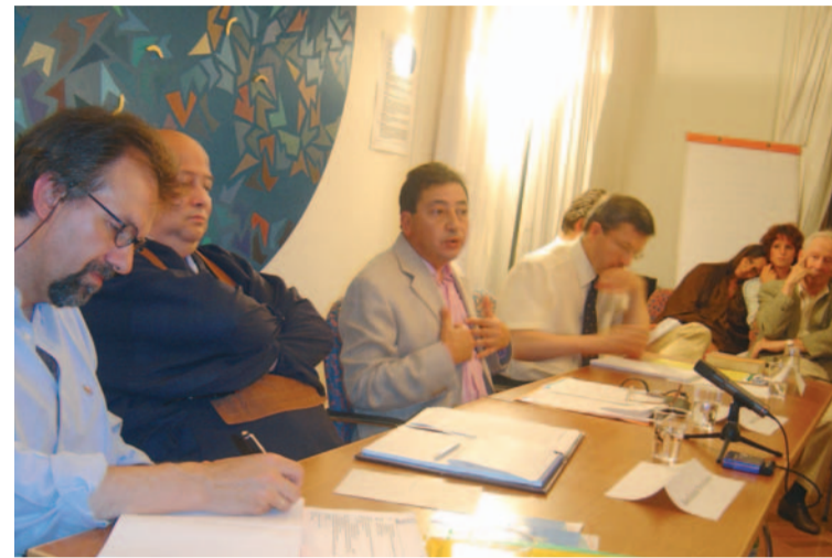
Bouddhiste, musulman, chrétiens en discussion à l'Arzillier (septembre 2005)

Fondée en mars 1998 à Lausanne, l'association L'Arzillier , gérée par un comité interreligieux dont les membres sont issus des traditions chrétiennes, musulmane, bouddhiste, juive, bahà'ie et hindoue, est une Maison du dialogue pour la paix entre Eglises, religions et spiritualités. L'Arzillier a une double vocation: favoriser le dialogue entre communautés religieuses et au sein d'une même tradition entre différentes tendances. Elle organise des tables rondes thématiques, accueille des groupes, réunit régulièrement les responsables religieux, publie un bulletin.