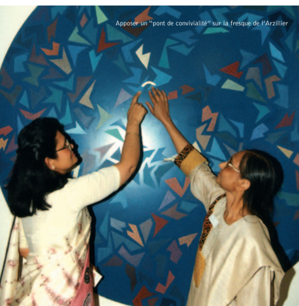
Apposer un "pont de convivialité" sur la fresque de l'Arzillier